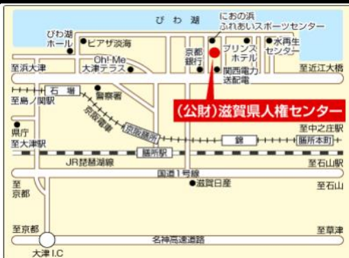
第5講座以外 (公財) 滋賀県人権センター 住所: 大津市におの浜4-1-14 ☎ 077-522-8243