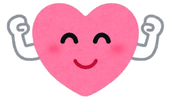
自尊感情を どう高めるか