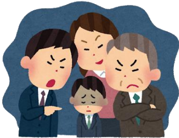
ハラスメントと人権