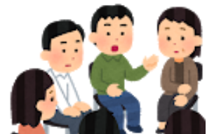
部落差別 (同和) 問題と人権