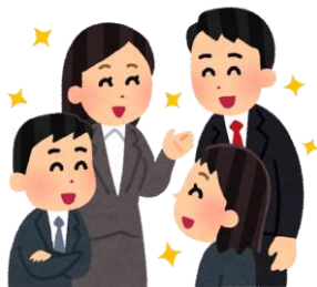
職場の人間関係 (アンガーマネジメント アサーション 境界線・・・)