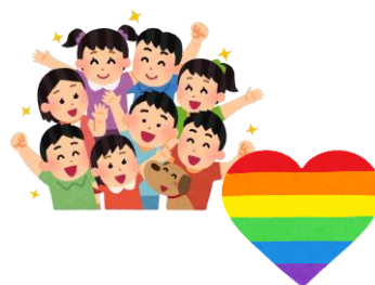
多様性 (ダイバーシティ) 尊重と人権