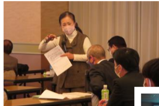
2019・2020年度の講座の様子